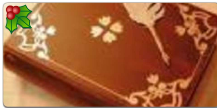
CRÓNICAS DE VIAJES