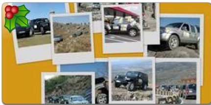
GALERÍA DE FOTOS