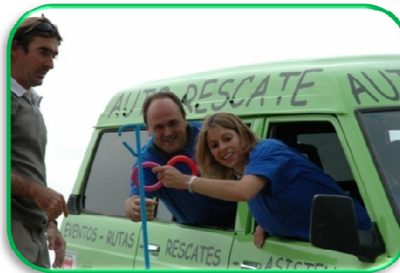
LANZAMIENTO DE ANILLAS